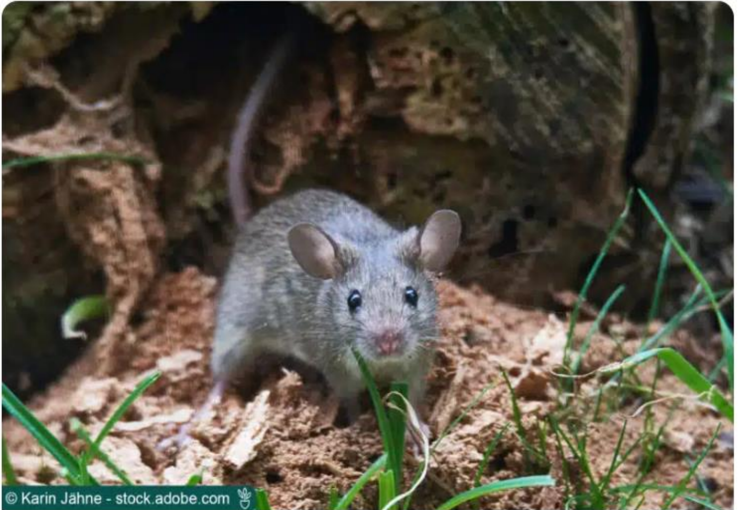
Hausmaus ( Mus musculus )