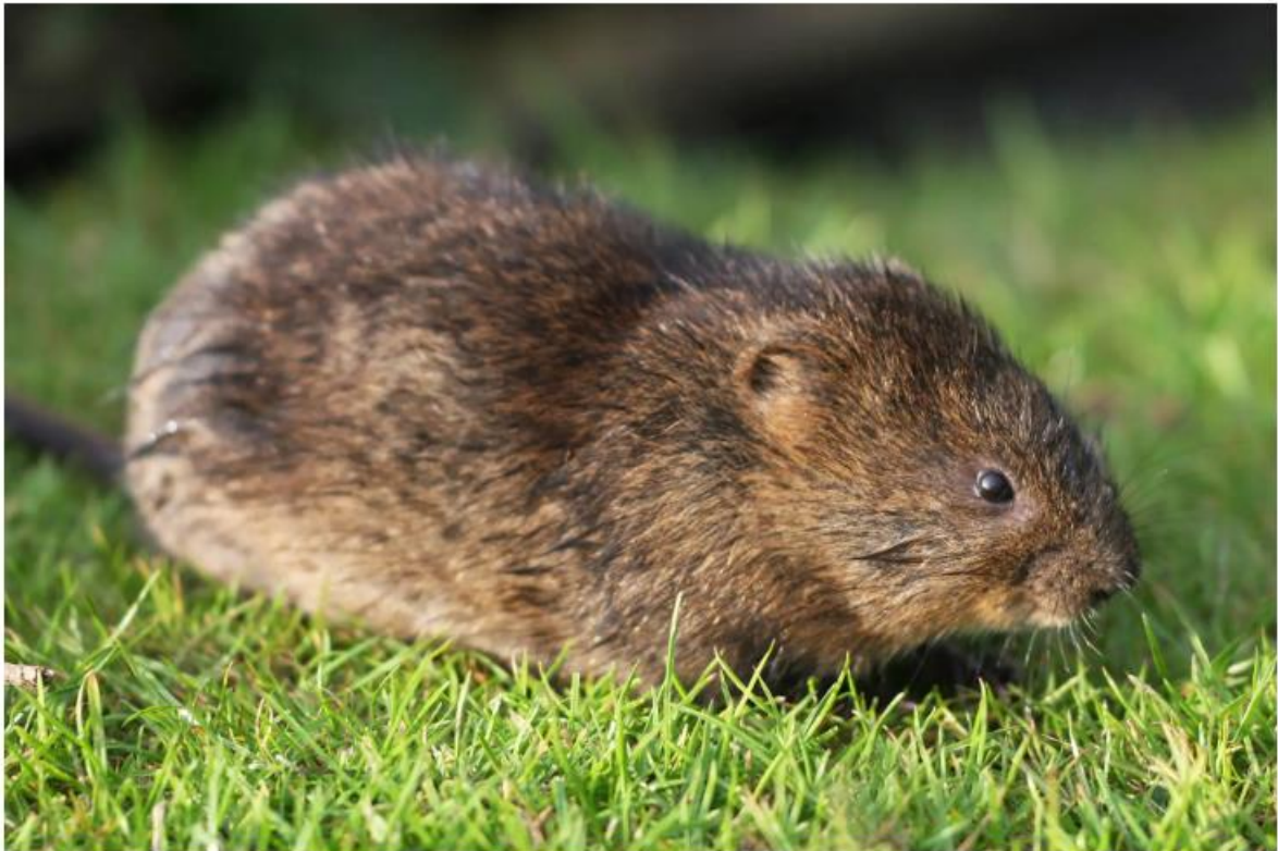
Die Wühlmaus kann im Garten großen Schaden anrichten.

Unser Hauptproblem, da sie an Wurzeln, Rinde und Früchten etc. nagen. Sie schädigen also in unseren Gärten die mit «Liebe» gehegten und gepflegten Pflanzen, meist sogar noch bevor diese Früchte tragen.