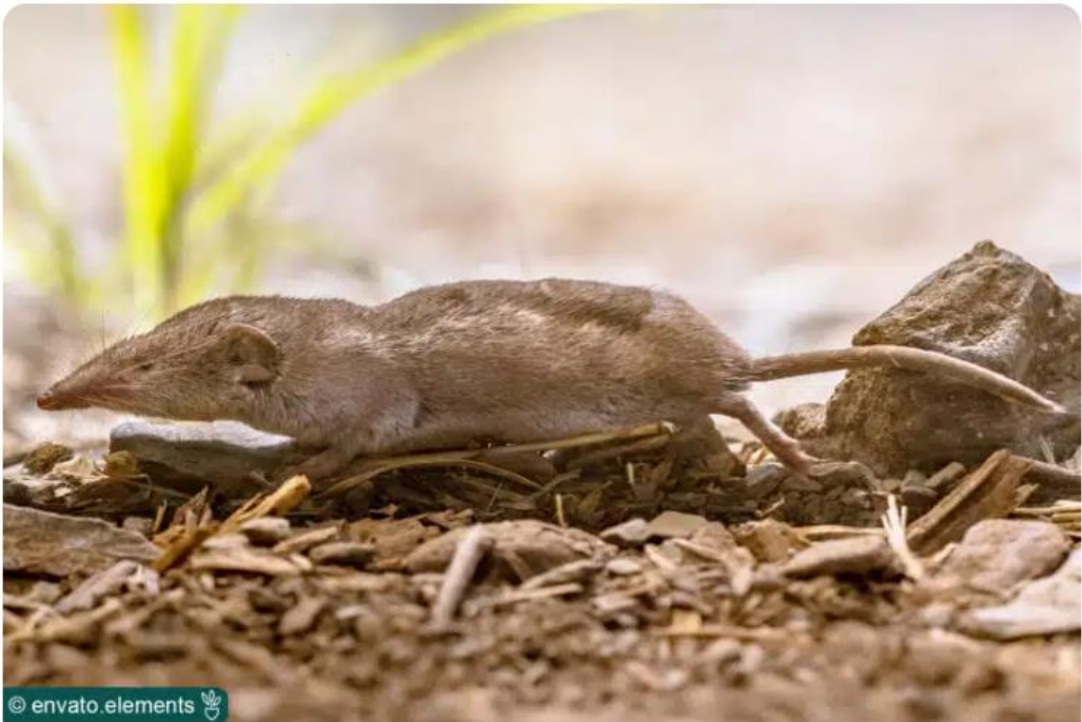
Gartenspitzmaus ( Crocidura suaveolens )