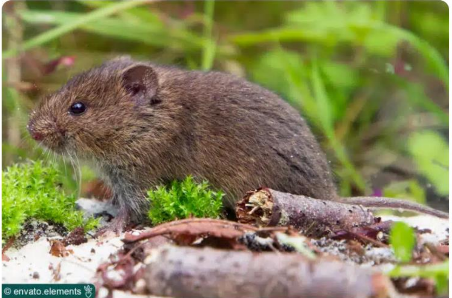
Feldmaus ( Microtus arvalis )