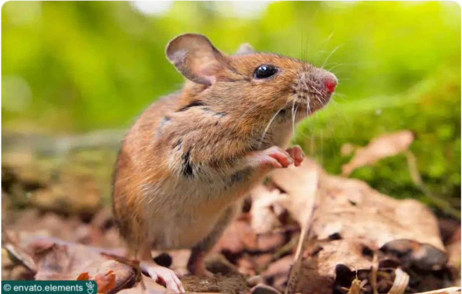
Waldmaus ( Apodemus sylvaticus )